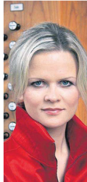
Iveta Apkalna eröffnet heute die Konzertreihe in St. Martin.

Den Beginn macht die lettische Konzertorganistin Iveta Apkalna. Sie pflegt zu dem Instrument eine ganz besondere Beziehung: Ihre CD-Aufnahme „Himmel und Erde“, die sie auf der Wangener Rieger-Orgel aufnahm, brachte ihr den begehrten „Echo“ als Instrumentalistin des Jahres, ein Umstand, der ihre Karriere als Konzertorganistin entscheidend förderte. Am heutigen Dienstag wird sie Werke von Johann Sebastian Bach und Franz Liszt sowie französische Orgelmusik spielen.