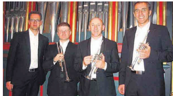
Orgel und drei Trompeten sind beim Jubiläumskonzert am 18. Juli zu hören.

Der Eintritt zu den Konzerten beträgt 8 Euro, (Ausnahme Jubiläumskonzert: 10 Euro) In der Tabakstube im Ratloch kann man im Vorverkauf Karten zu 7 Euro erwerben.